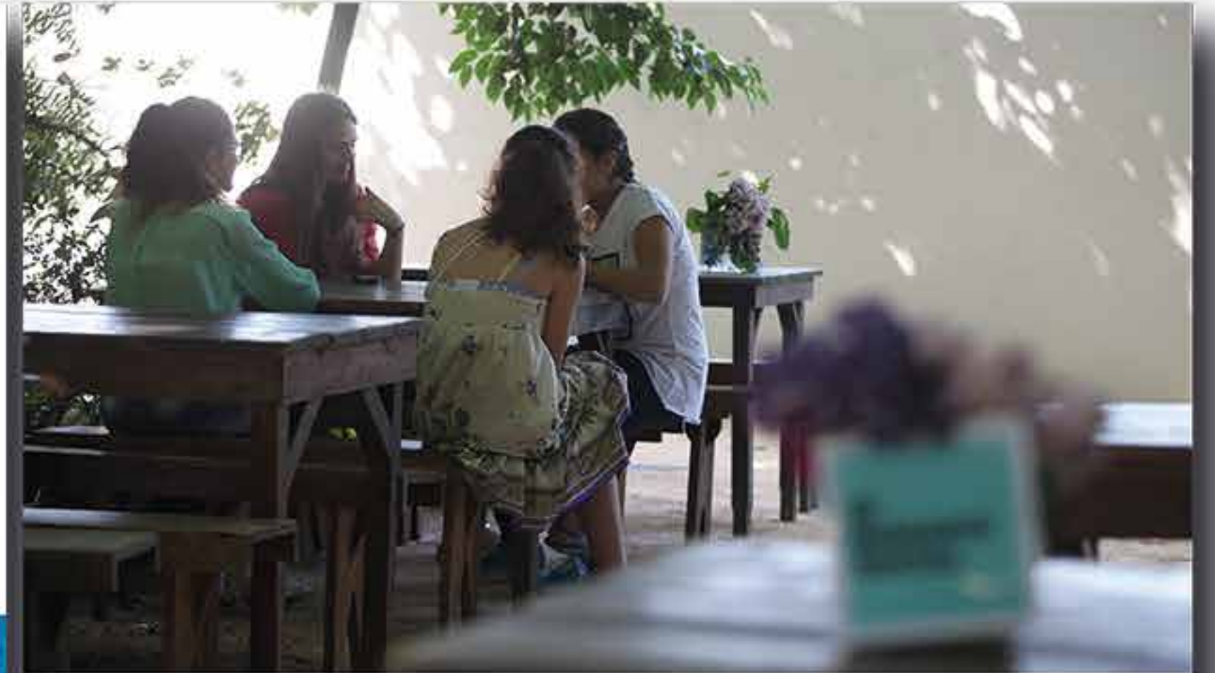
III Edição Mosaico Social - Santa Maria de Lamas - 2013