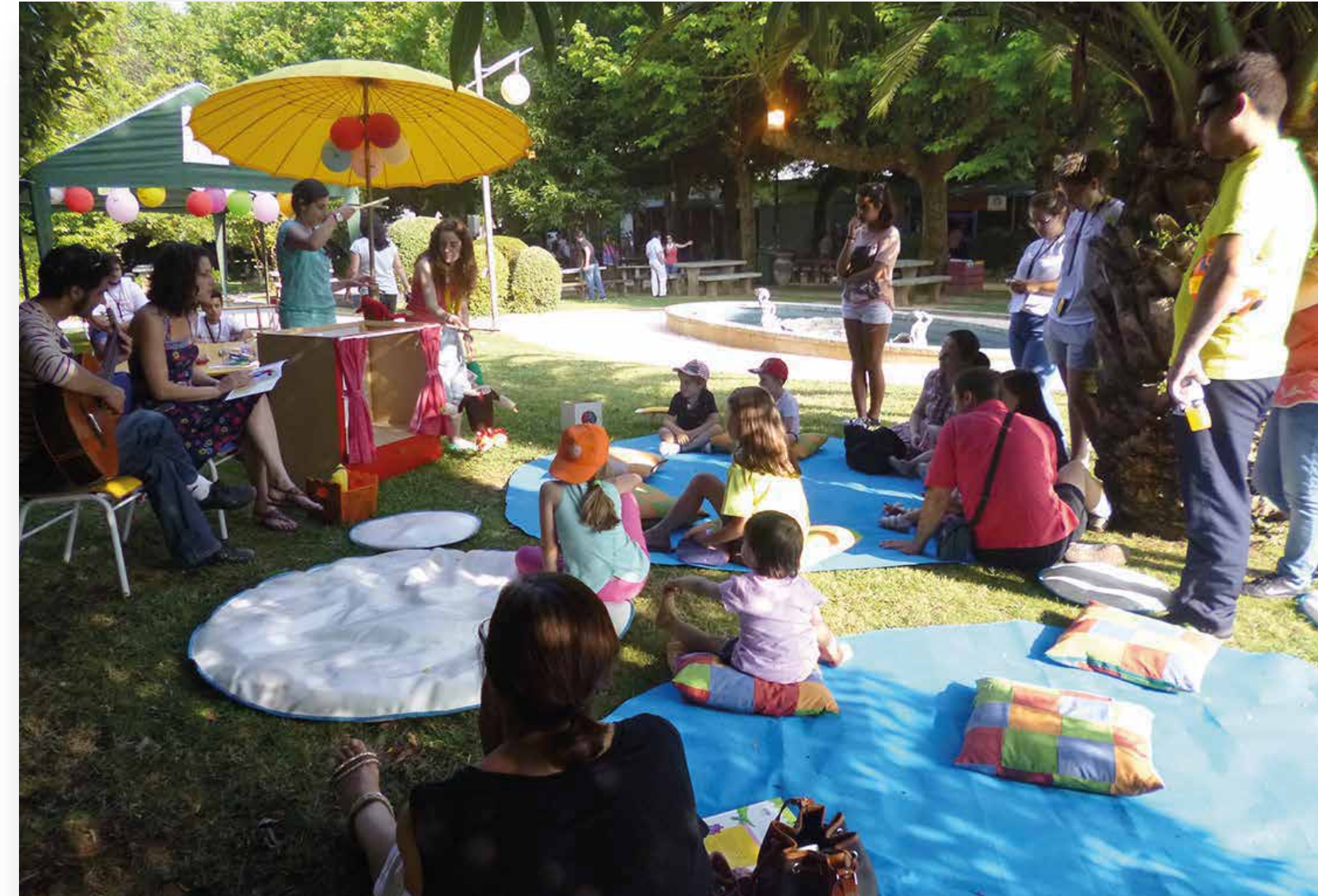
III Edição Mosaico Social - Santa Maria de Lamas - 2013