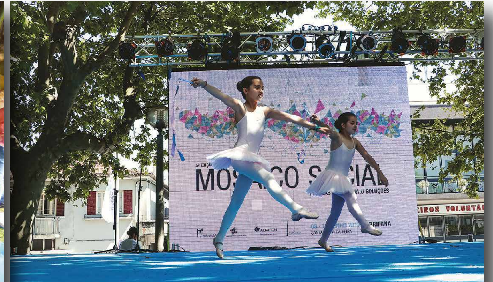
V Edição Mosaico Social - Arrifana - 2017