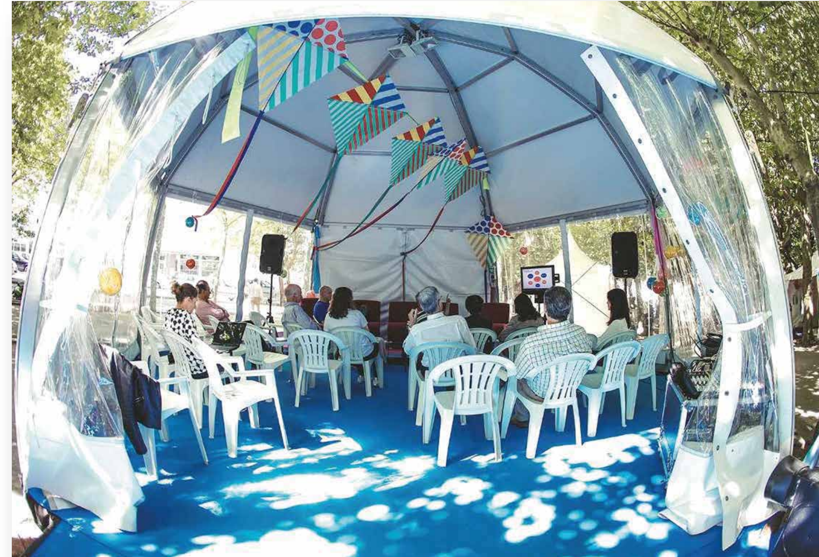
V Edição Mosaico Social - Arrifana - 2017