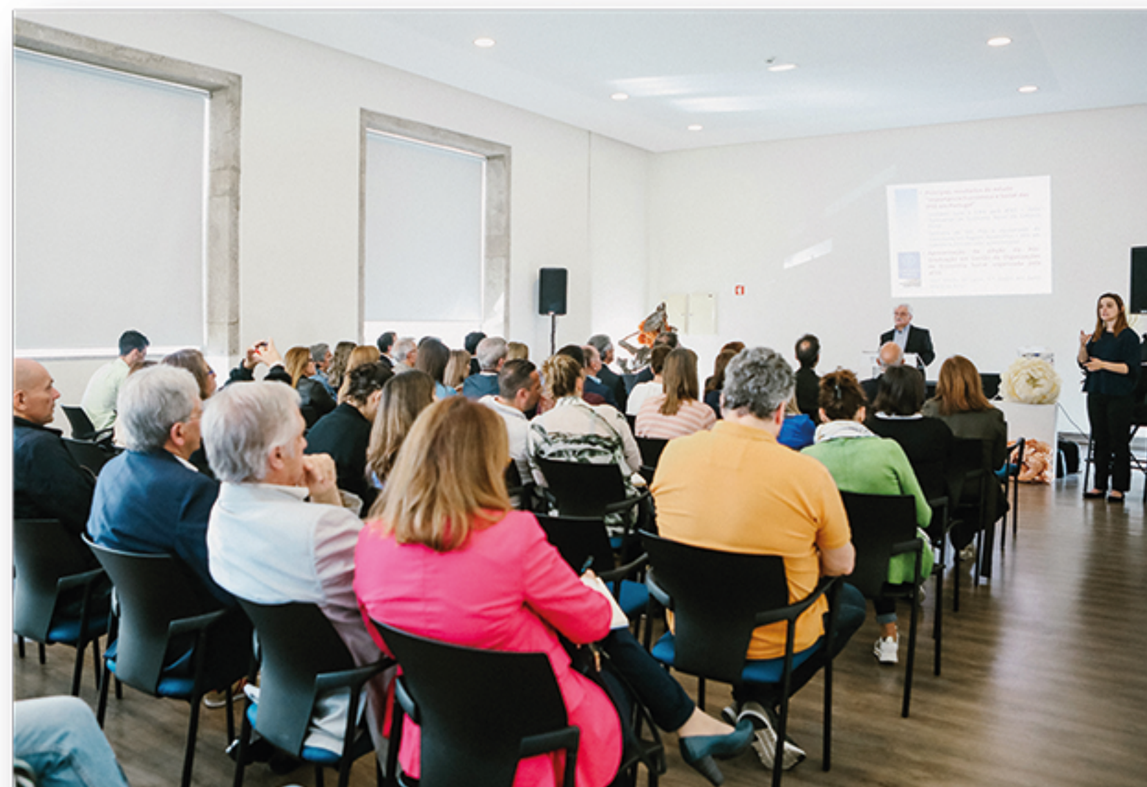
VI Edição Mosaico Social - Lobão, Gião, Louredo e Guisande - 2019