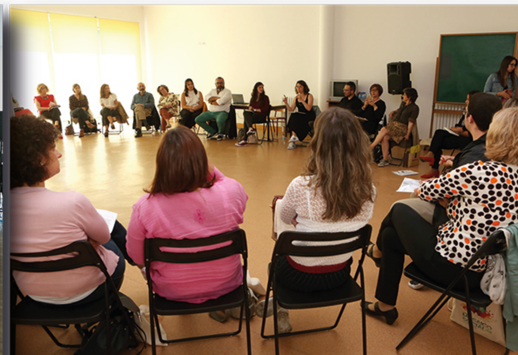
VI Edição Mosaico Social - Lobão, Gião, Louredo e Guisande - 2019