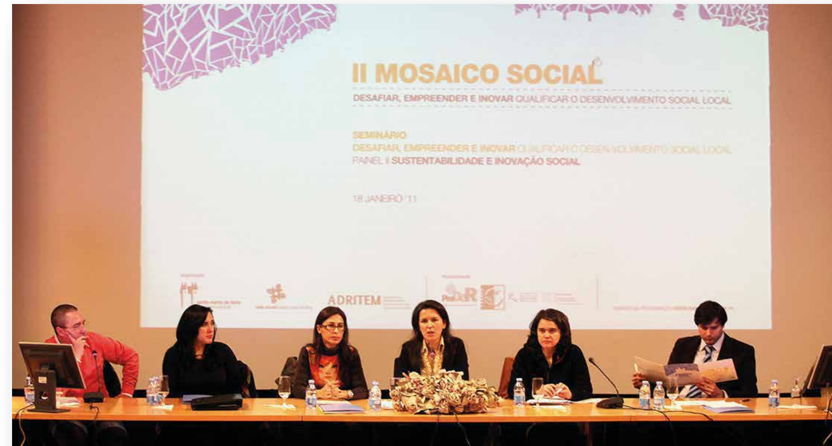
II Edição Mosaico Social - Santa Maria da Feira - 2011