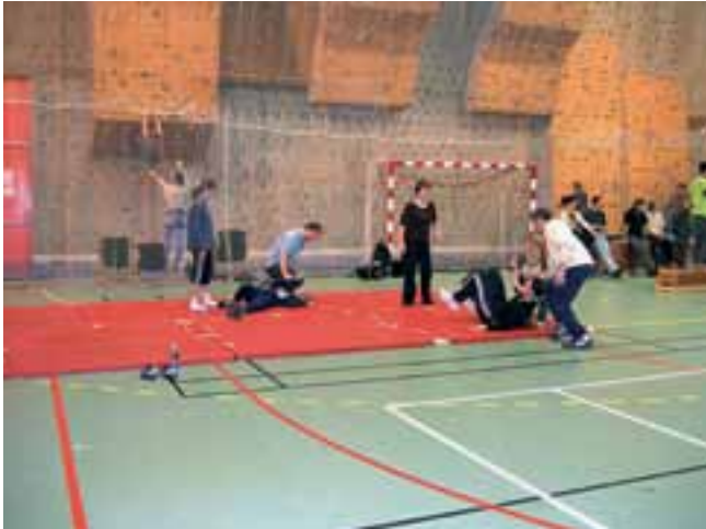
Actividades de autodefensa y escalada.