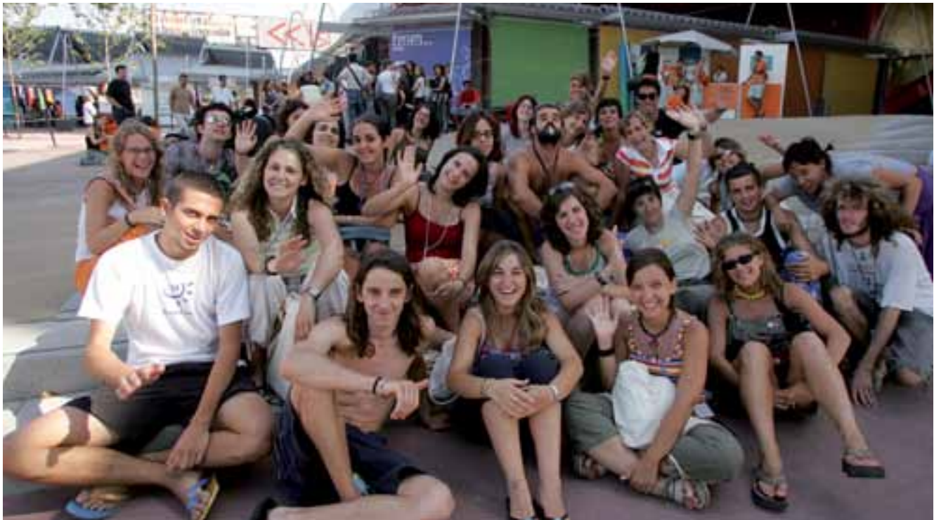
© Fundación Fórum Universal de las Culturas