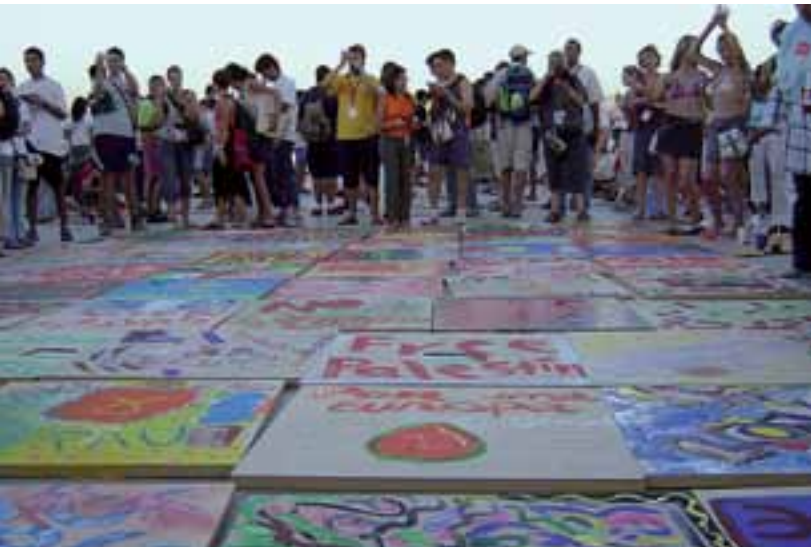
Festival Mundial de la Juventud 2004, celebrado en Barcelona, del cual el CJB fue una de las entidades promotoras.