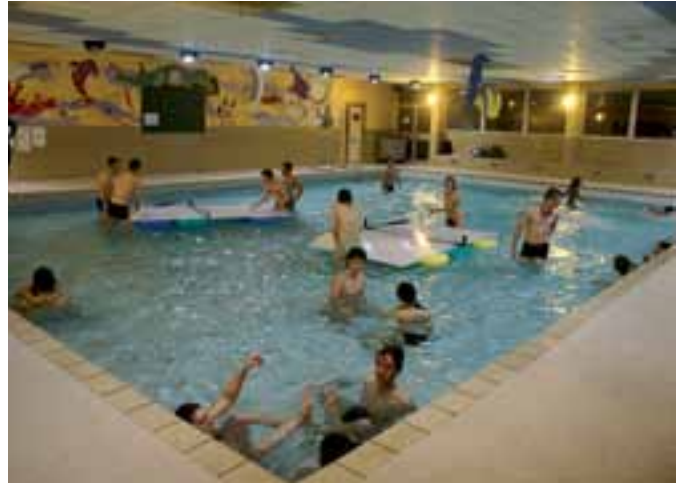
Las piscinas permanecen abiertas con actividades originales como ping-pong en el agua.

notoria en el espacio público), el objetivo de poner en valor el rol de los y las jóvenes en los barrios ha comportado el desarrollo de un gran número de acciones y la adaptación específica de los dispositivos anteriormente explicados, como por ejemplo: