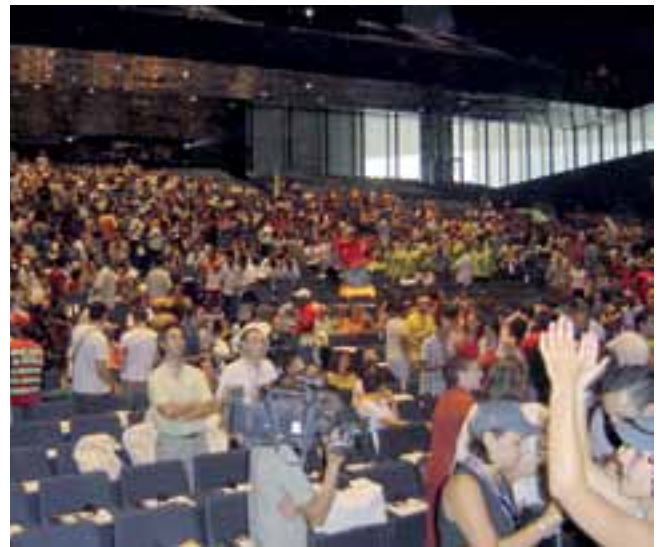
El órgano de decisión del CJB es su Asamblea, formada por representantes de todas las entidades miembro.

las conclusiones y las propuestas para hacerlas públicas. Así, por ejemplo, nos hemos manifestado cuando las federaciones de asociacionismo educativo, los clubes de ocio educativo y las agrupaciones escultistas vieron la necesidad de reivindicar su reconocimiento social para solicitar un mayor financiamiento y unos espacios de calidad donde poder desarrollar su tarea como escuelas de ciudadanía activa que son. En todas las elecciones organizamos alguna campaña para que los y las jóvenes participen y puedan incidir en ellas. También, realizamos un recorrido en un bus turístico con representantes de asociaciones, técnicos y políticos del Ayuntamiento para visitar y reivindicar modelos de equipamientos juveniles donde los y las jóvenes puedan participar y decidir en su gestión. Por otra parte, reivindicamos a los medios de comunicación que transmitan referentes positivos de juventud. Una parte extensa de nuestras acciones y proyectos están destinados a fomentar la participación y el asociacionismo entre los y las jóvenes de la ciudad. Por ello, trabajamos, por ejemplo, en muchos proyectos de forma conjunta con los centros de educación secundaria o hacemos campañas publicitando las asociaciones existentes, aprovechando el inicio del curso escolar y la Fiesta Mayor de la ciudad.