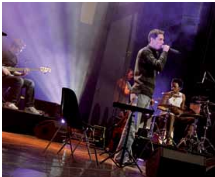
Concierto del artista francés "Grand corps malade" durante una Velada Ciudadana.