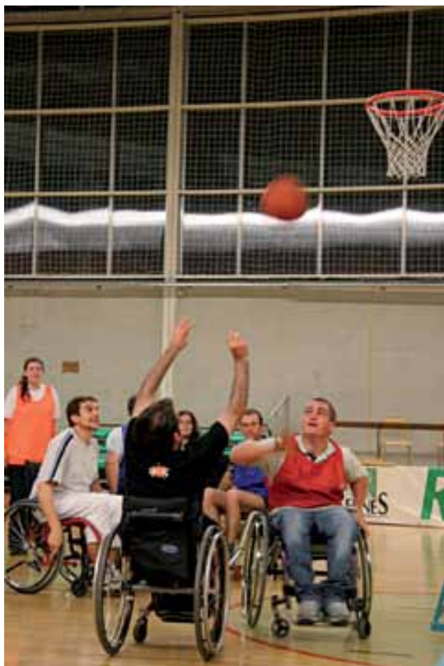
Baloncesto, rugby o kin-ball en silla de ruedas, fútbol para invidentes o torball son propuestas para las personas discapacitadas abiertas a todos los jóvenes, que permiten compartir una práctica deportiva en las mismas condiciones.

y no de competición, lo que no excluye necesariamente la realización de competiciones, torneos locales o entre barrios, etc.