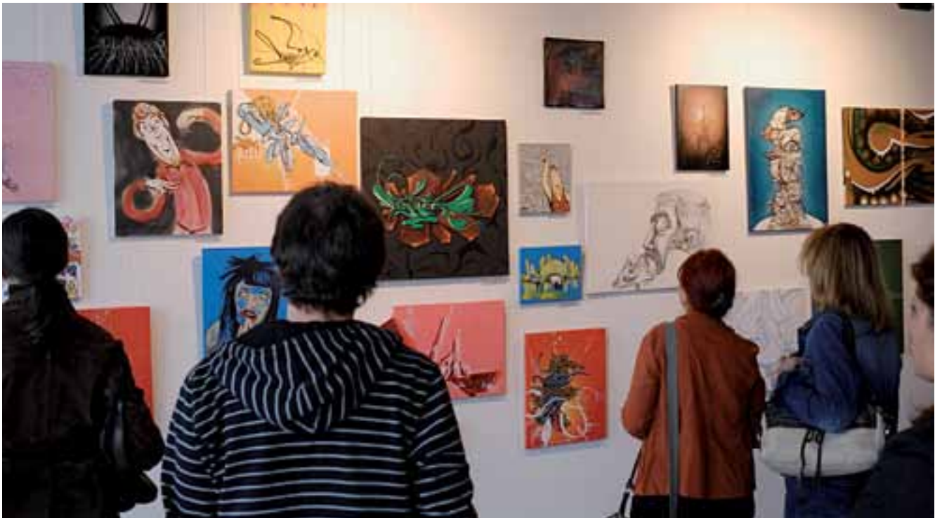
Exposición 'Primart' de jóvenes artistas.