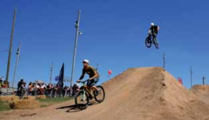
Fiesta de la bici.