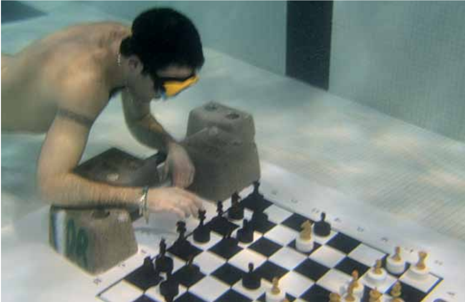
Además del deporte, las asociaciones proponen actividades culturales, conciertos, pase de películas, etc. En esta foto, una partida de ajedrez en el fondo de la piscina.

espacios en cada barrio, en horarios e instalaciones identificados como pertinentes por los profesionales de juventud.