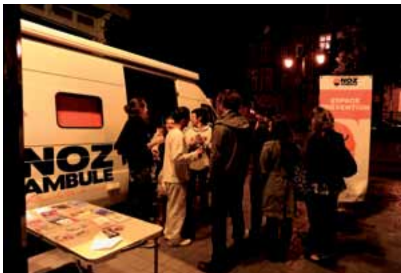
Dispositivo de prevención de riesgos Noz'ambule (Rennes).

Los procesos de globalización y modernización han tenido enormes consecuencias en la vida de todos los miembros de la sociedad y especialmente en la juventud, durante la transición de la educación a la vida laboral y adulta. Los continuos cambios económicos y sociales ocasionados por la globalización dificultan la capacidad de predecir futuros desarrollos en estos ámbitos y provocan inseguridad e incertidumbre en la vida social y laboral. Para todos los actores sociales, y en especial para la juventud, tomar decisiones racionales relacionadas con proyectos personales a largo plazo se hace difícil, debido a la complejidad y a la falta de definición de las posibles alternativas y sus consecuencias. Sobre la base de esta incertidumbre e inseguridad, las estructuras, tradiciones y normas locales adquieren cada vez más importancia en la construcción de la identidad y la orientación de la vida de cada persona. Además, como la toma de decisiones estratégicas a largo