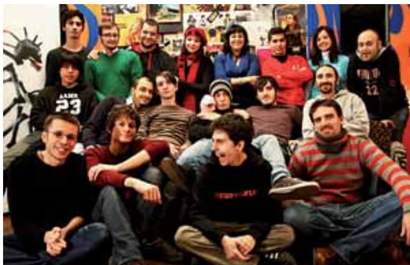
Es competencia del Estado garantizar a las y los jóvenes el derecho a elegir y a emanciparse.