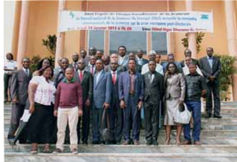
Participantes del Encuentro de Jóvenes Africanos sobre la crisis post-electoral de Costa de Marfil.