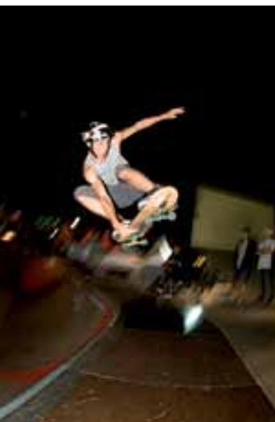
Concurso de monopatín, Festival de Deportes Urbanos Asphaltissimo.