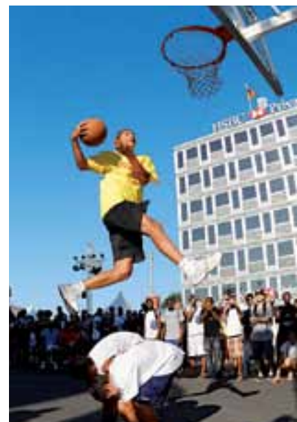
Torneo de baloncesto durante el Festival Asphaltissim.

cerca de 450.000 habitantes, 1,5 millones si se tiene en cuenta la totalidad de la región transfronteriza) más de 1.500 jóvenes no han acabado los estudios ni cuentan con un proyecto concreto de futuro.