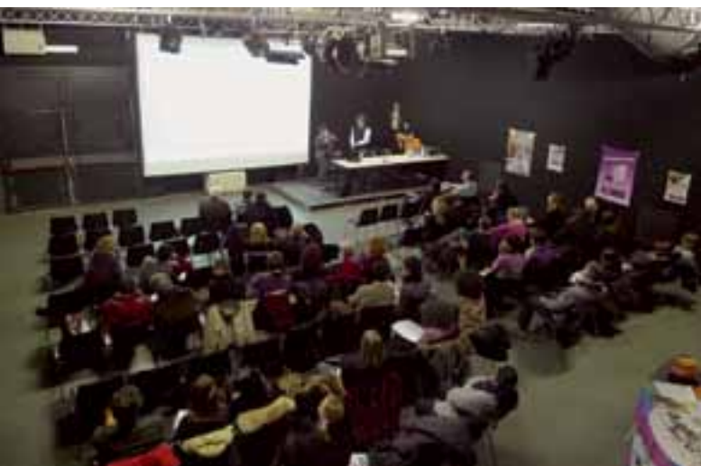
Apoyar el asociacionismo es la finalidad del Torino Youth Centre , una red formada por 16 asociaciones de jóvenes.