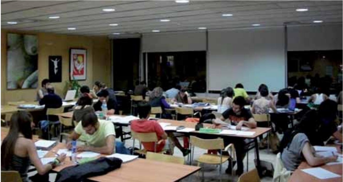
Salas de estudio en horario nocturno.

Por último, todos estos cambios también han incidido en la participación política y social de la juventud. Pese a que la participación formal de las y los jóvenes en las estructuras e instituciones políticas existentes está disminuyendo prácticamente en todo el mundo, se observa que en muchos países de Europa y Latinoamérica la juventud juega un papel importante, a veces primordial, en los movimientos que tienen por objetivo la transformación y el cambio social. Además del uso creativo que hacen de Internet para llamar a la movilización (por ejemplo e-mails, Blogs, Facebook, Twitter, etc.), su presencia es considerable en las ONG del llamado "tercer sector" y en diferentes movimientos sociales basados en la comunicación electrónica, trabajos de voluntariado y otras formas de participación informal. Asimismo, están muy implicados en movimientos activistas contra la globalización.