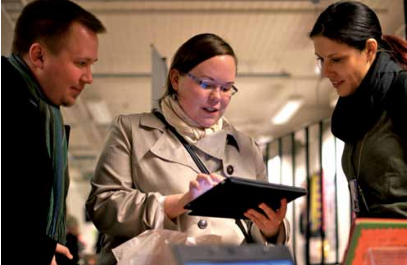
Jóvenes leyendo un cómic en un e-book durante el Festival de cómics de la Biblioteca Municipal de Tampere.

Nos enfrentamos, por lo menos, a dos problemas. La juventud no es una categoría aceptable para quien aspira a realizar un análisis en profundidad. Hay gente joven, de eso no cabe duda. Hay conflictos generacionales, ídem . Pero el inconveniente de tal aproximación es que tiende a meter a todos los y las jóvenes en el mismo saco cuando lo fundamental es atender los problemas que plantean la diversidad de condiciones, las desigualdades de acceso y otras diferencias.