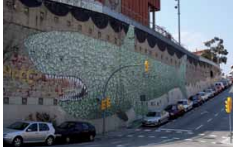
Graffitis, tags, pegatinas, etc. son instrumentos de expresión identitaria, a través de los cuales los jóvenes manifiestan su presencia en el territorio urbano.

activos y conscientes, sino productores activos de símbolos y significados (Isin y Wood, 1999: 152).