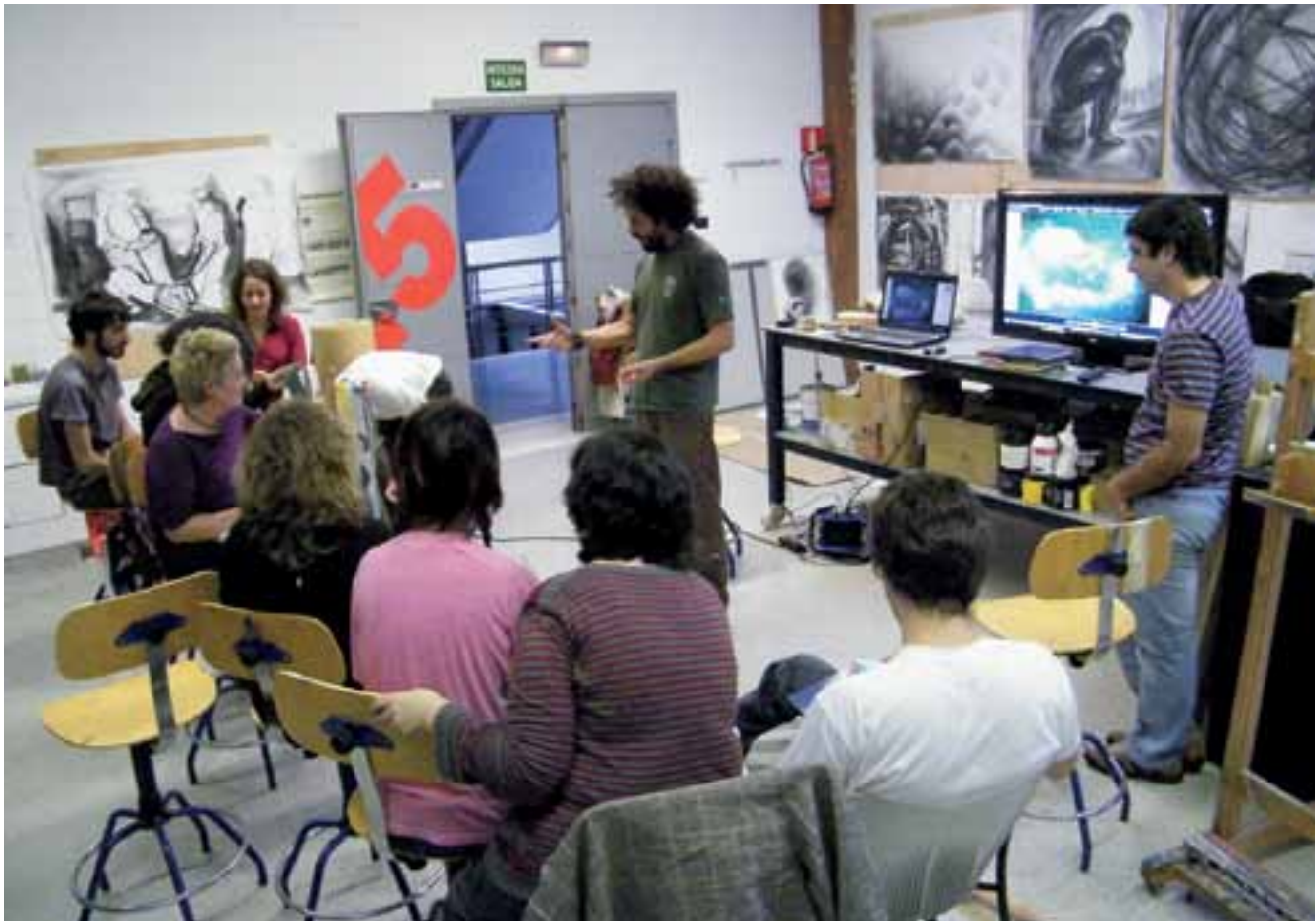
Centro de producción artística.

sino en el conjunto de todas las áreas de acción, aunque se establezcan diferentes prioridades, en función de algunas variables concretas, como los subgrupos de edad (dentro de la franja de edades anteriormente mencionada), el género, el nivel educativo, el origen étnico o problemas específicos que se consideren prioritarios en las diferentes fases de desarrollo, etapas o momentos de la vida de las y los jóvenes.