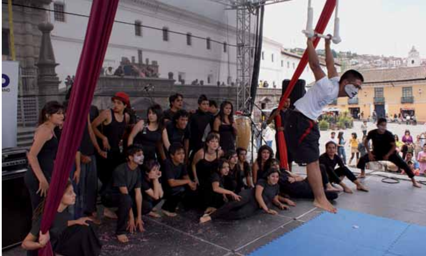
Celebración del Día de la Juventud.