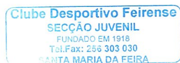
(Paulo Sérgio Bastos Pais)