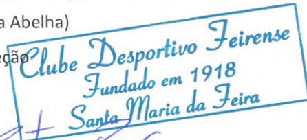
(Paulo Sérgio Bastos Pais)